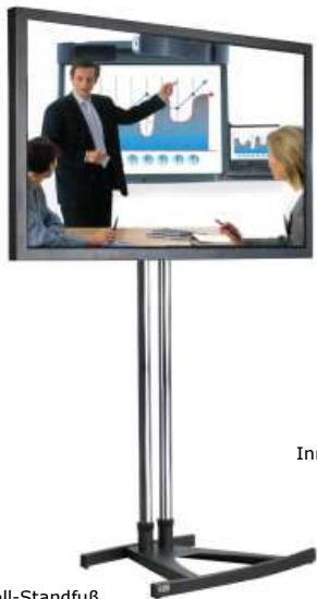
Roll-Standfuß Grundfläche: 60 x 87 cm