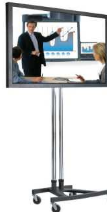
Roll-Standfuß Grundfläche: 60 x 87 cm

Bei Bestellung immer Display Typ und Modell mit angeben!