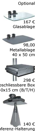
Optional 167 € Glasablage 98,00 Metallablage 40 x 50 cm 298 € abschliessbare Box Innenmaß 55x40x15 cm (B/T/H) 140 € Videokonferenz-Halterung