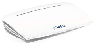
W-Air Base Small Business