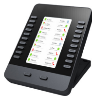
WP490 EXT Erweiterungsmódul