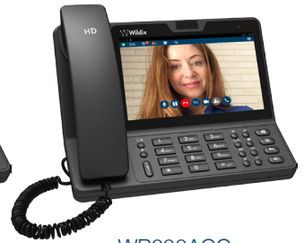
WP600ACG in Weiß oder Schwarz erhältlich