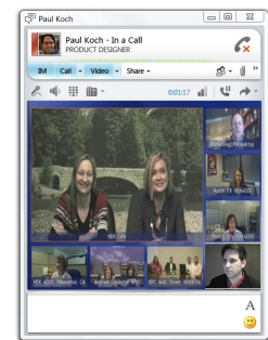
Integration von Videolösungen in Microsoft Lync